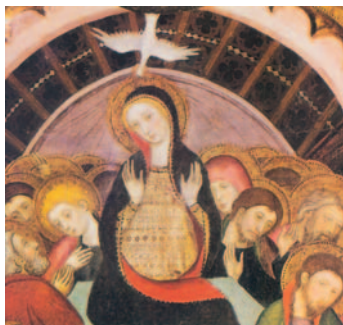
La vinguda de l'Esperit Sant sobre Maria i els Apòstols. Obra de Jaume Serra. MNAC, Barcelona

»La paz os dejo, mi paz os doy; no os la doy yo como la da el mundo. Que no tiemble vuestro corazón ni se acobarde. Me habéis oído decir: «Me voy y vuelvo a vuestro lado». Si me amarais, os alegraríais de que vaya al Padre, porque el Padre es más que yo. Os lo he dicho ahora, antes de que suceda, para que cuando suceda sigáis creyendo.»