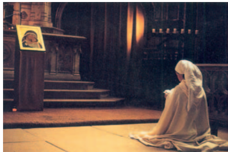
En la pregària s'expressa l'actitud de vigilància que recomana Jesús a l'Evangeli d'avui

Tenim posada l'esperança en el Senyor, / auxili nostre i escut que ens protegeix. / Que el vostre amor, Senyor, no ens deixi mai; / aquesta és l'esperança que posem en vós. R.