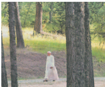
Benet XVI passejant pels boscos de la Vall d'Aosta, on passà uns dies de vacances l'any passat

A l'Evangelí de Marc trobem un passatge en què es narra que després d'uns dies d'especial fatiga, el Senyor digué als deixebles: «Veniu amb mi a un lloc solitari i descansau una mica». Ja que la paraula de Crist mai no està vinculada tan sols amb el moment en què la pronuncia, crec que constitueix també una invitació a viure cristianament el fet de les vacances. Per descomptat per aquelles que puguin