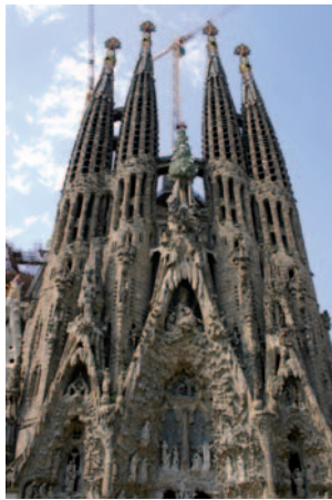
Façana de La Passió del Temple de la Sagrada Família

Aquesta preparació ha de tenir sobretot una dimensió espiritual, però també té un aspecte organitzatiu que demana l'esforç i la col·laboració de tots.