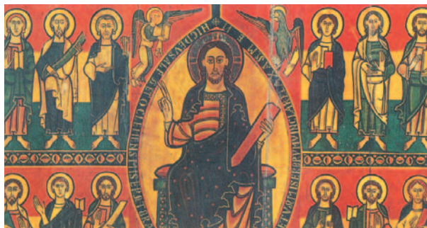
Jesucrist i els dotze apòstols. Frontal d'Esquius. Museu Diocesà de Barcelona

Festejad a Jerusalén, gozad con ella, todos los que la amáis, alegraos de su alegría, los que por ella llevasteis luto. Mamaréis a sus pechos y os saciaréis de sus consuelos, y apuraréis las delicias de sus ubres abundantes. Porque así dice el Señor: «Yo haré derivar hacia ella, como un río, la paz, como un torrente en crecida, las riquezas de las naciones. Llevarán en brazos a sus criaturas y sobre las rodillas las acariciarán; como a un niño a quien su madre consuela, así os consolaré yo, y en Jerusalén seréis consolados. Al verlo, se alegrará vuestro corazón, y vuestros huesos florecerán como un prado; la mano del Señor se manifestará a sus siervos.»