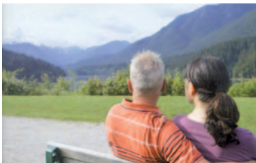
La violència contra les dones contradia el respecte que es mereix cada persona

Les violències conjugals són una greu realitat, que durant molt de temps ha estat un tema tabú i de la qual actualment comencem a conèixer-ne la magnitud. No és patrimoni únicament dels ambients desfavorits, sinó que toca en major o menor mesura totes les categories socials. Les causes d'aquestes violències són múltiples. I actuar sobre aquestes causes seria un bon treball de prevenció d'aquesta xacra social.