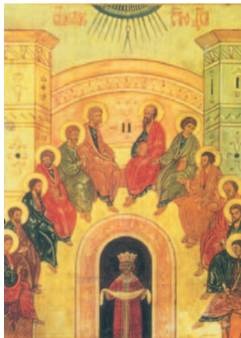
La vinguda de l'Esperit Sant, icona oriental

Glària al Senyor per sempre. / Que s'alegri el Senyor contemplant el que ha fet, / que li sigui agradable aquest poema, / són per al Senyor aquests cants de goig. R.