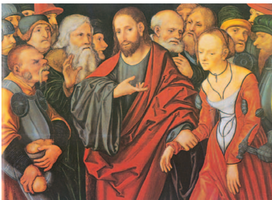
Crist perdona la dona adúltera. Pintura de Lucas Cranach (s. xv). Museu de Capo di Monte (Nàpols)

Al ir, iba llorando, / llevando la semilla; / al volver, vuelve cantando, / trayendo sus gavillas. R.