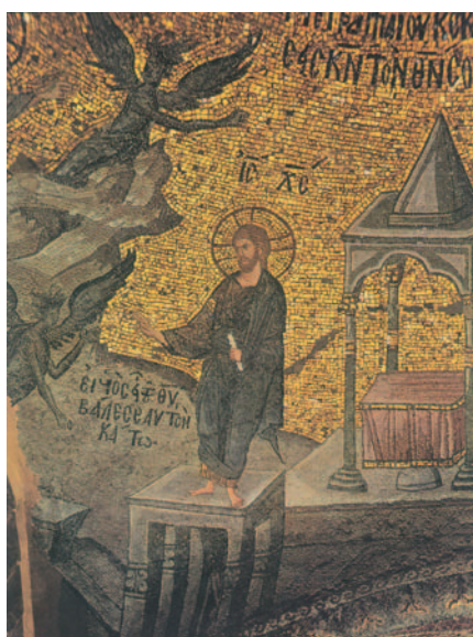
Les temptacions de Crist al desert, mosaic bizantí de l'església de Sant Salvador, Istanbul

Completadas las tentaciones, el demonio se marchó hasta otra ocasión.