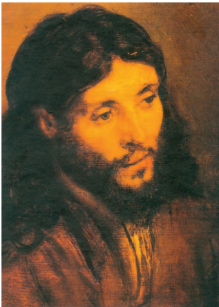
Faç de Crist. Pintura de Rembrandt. Museu Dahlem, Berlín

Explicando tus hazañas a los hombres, / la gloria y majestad de tu reinado. / Tu reinado es un reinado perpetuo, / tu gobierno va de edad en edad. R.