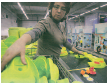
Treball per a tots, una aspiració cada vegada més difícil d'aconseguir

Avui, amb la crisi econòmica, tenim arreu un problema molt greu que afecta moltes persones i moltes famílies: l'atur. A Espanya ja ha superat els quatre milions. Manca molt treball en el món. L'atur és gravíssim. Joan Pau II hi ha fet referència en moltes ocasions i sempre amb paraules que expressen aquesta gravetat: «el fenomen creixent de l'atur», «la terrible plaga de l'atur», «l'atur que afligeix tantes famílies i tants joves», «la tragèdia de l'atur que mena molts homes i moltes dones a la desesperació o a engruixir les fileres dels marginats socials», etc. I en l'encíclica Laborem exercens , el qualificava com «la clau contemporània de tota la qüestió social».