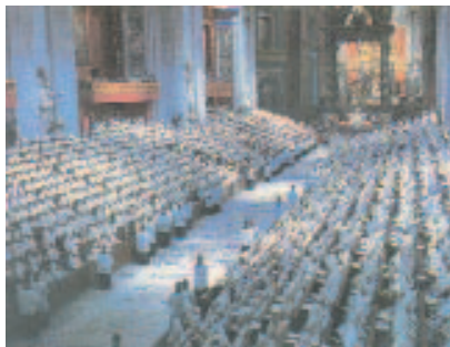
La declaració sobre la llibertat religiosa Dignitatis humanae fou un dels documents aprovats pel Concili Vaticà II

Desitjo subratllar dues iniciatives vinculades a aquesta data. La primera és que el Papa publica cada any un missatge, que és àmpliament divulgat i que és lliurat als caps d'Estat i als dirigents dels diversos governs. Aquests missatges són d'una gran riquesa i constitueixen una veritable actualització de la doctrina social de l'Església amb relació als problemes de la pau.