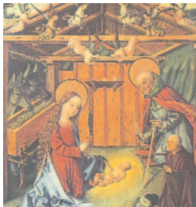
Naixement del Salvador. Tríptic del Mestre d'Àvila. Museu Lázaro Galdiano (Madrid)

En el principio ya existía la Palabra, y la Palabra estaba junto a Dios, y la Palabra era Dios. La Palabra en el principio estaba junto a Dios. Por medio de la Palabra se hizo todo, y sin ella no se hizo nada de lo que se ha hecho. En la Palabra había vida, y la vida era la luz de los hombres. La luz brilla en la tiniebla, y la tiniebla no la recibió. Surgió un hombre enviado por Dios, que se llamaba Juan: este venía como testigo, para dar testimonio de la luz, para que por él todos vinieran a la fe. No era él la luz, sino testigo de la luz. La Palabra era la luz verdadera, que alumbraba a todo hombre. Al mundo vino y en el mundo estaba; el mundo se hizo por medio de ella, y el mundo no la conoció. Vino a su casa, y los suyos no la recibieron. Pero a cuantos la recibieron, les da poder para ser hijos de Dios, si creen en su nombre. Estos no han nacido de sangre, ni de amor carnal, ni de amor humano, sino de Dios. Y la Palabra se hizo carne, y acampó entre nosotros, y hemos contemplado su gloria: gloria propia del Hijo único del Padre, lleno de gracia y de verdad.