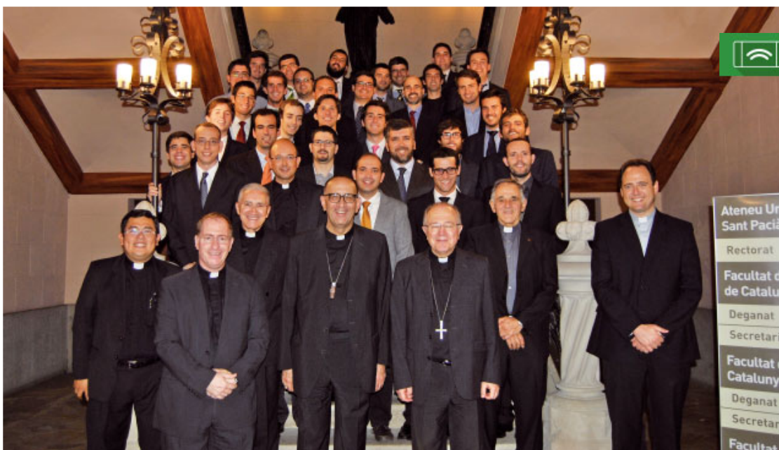
Inauguració del curs 2016-2017 al Seminari Conciliar

Demanem al Senyor que no faltin joves que responguin a la seva crida per ser sacerdots, servidors de la comunitat, instruments de l'amor de Déu cap a totes les persones. I acompanyem els nostres se-