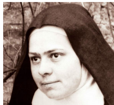
Sor Elisabet de la Trinitat

Era una dona molt humana, sensible a la natura, a l'art, a l'amistat, a la relació amb les persones, a l'amor entranyable i afectuós que manifesta a tots.