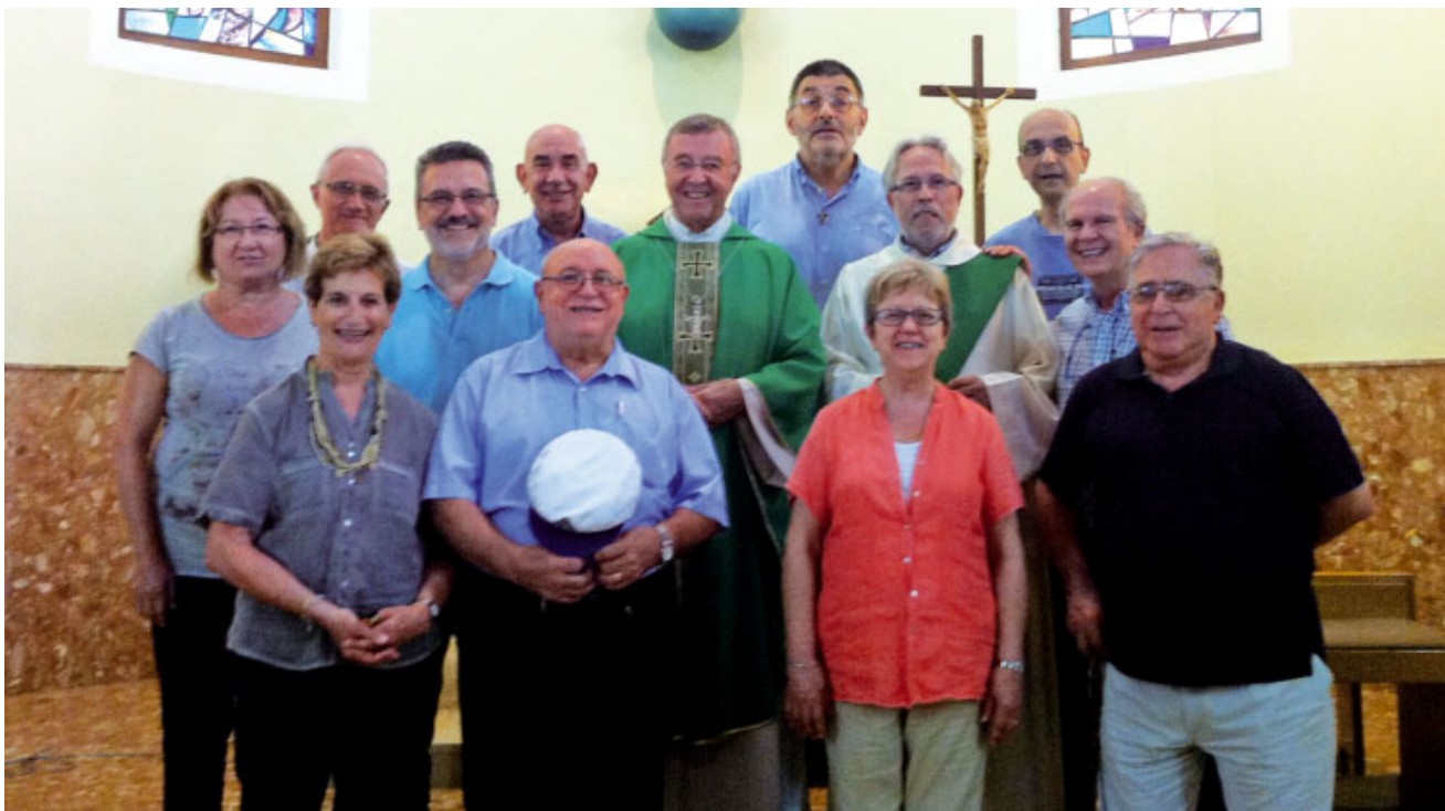
El grup de diaques i les seves esposes que assistiren al recés