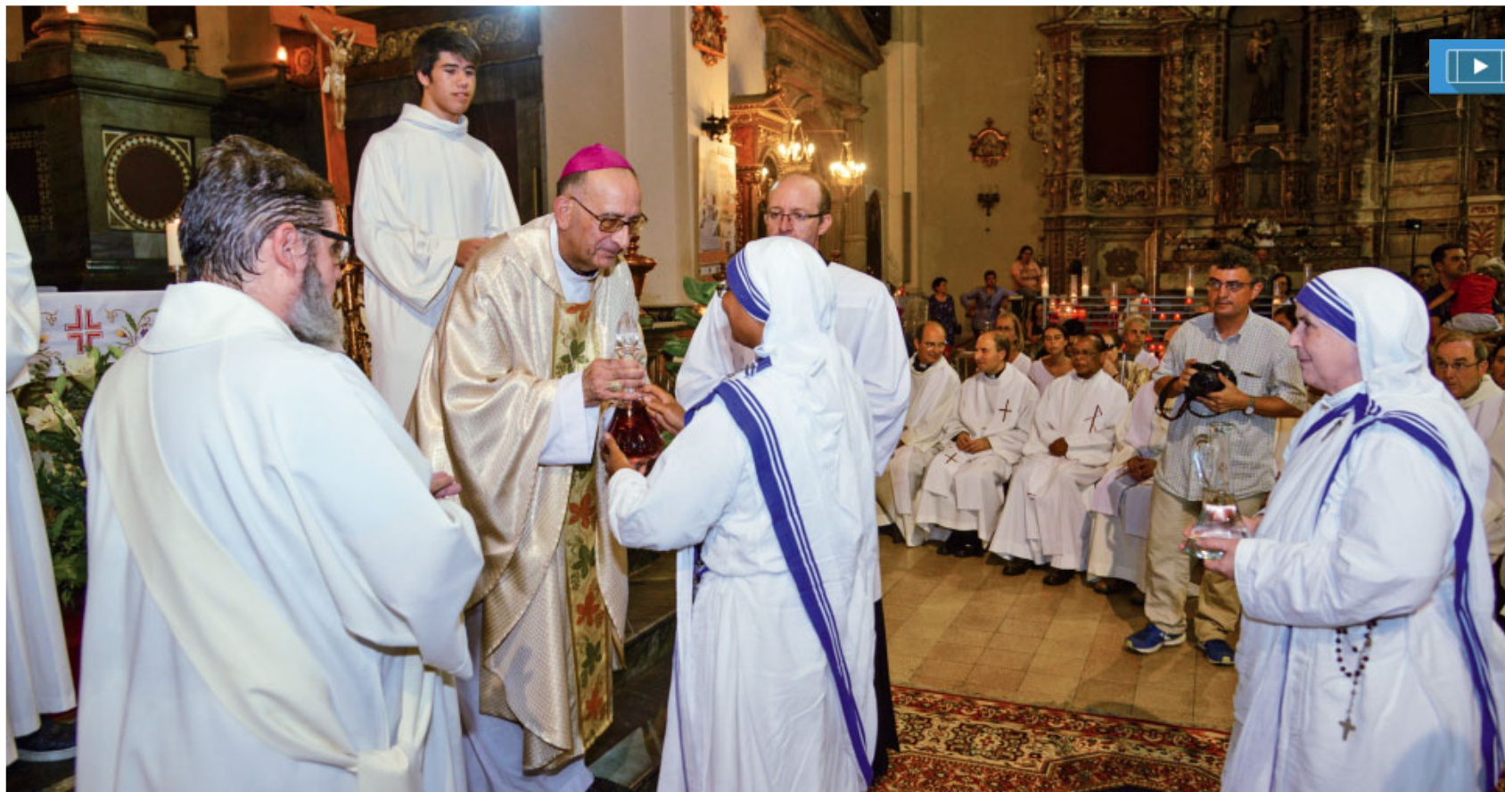
Unes Missioneres de la Caritat en el moment de les ofrenes