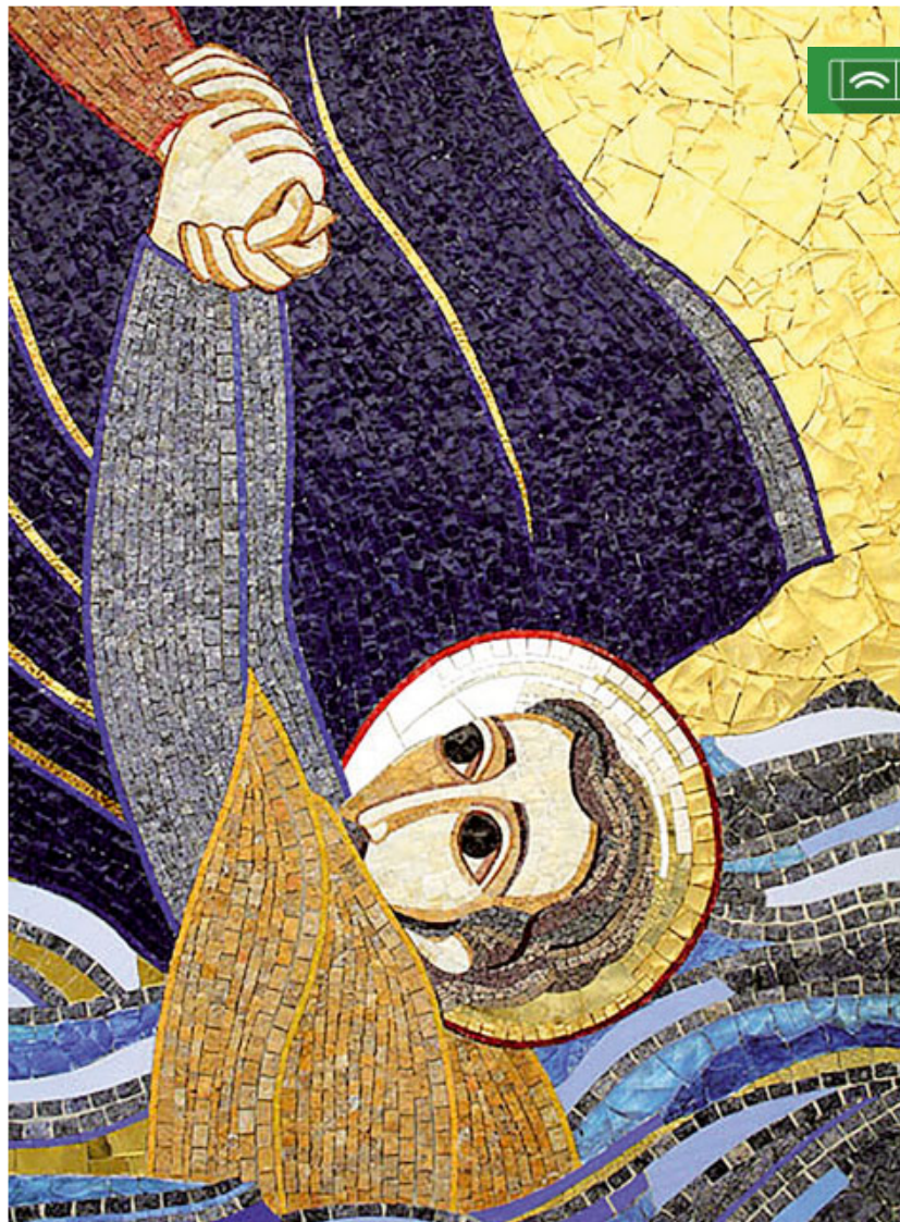
Jesucrist dona la mà a sant Pere quan aquest s'enfonsa al llac de Tiberiades (fragment d'un mosaic del P. Rupnik, SJ)

Davant el seu exemple d'entrega a Déu i a totes les esglésies, demanem al Senyor que ens concedeixi a tots, bisbes, sacerdots, religiosos i laics, la confiança i la valentia necessàries per seguir anunciant, com ell ho fa, «les seves meravelles» (1Cr 16,9) en tota circumstància, enmig de les diverses situacions que ens toquen viure en el nostre món. Amb la confiança posada en el Senyor, no podem acovardir-nos davant les dificultats ni cansar-nos de ser apòstols humils i valents enmig del nostre món.