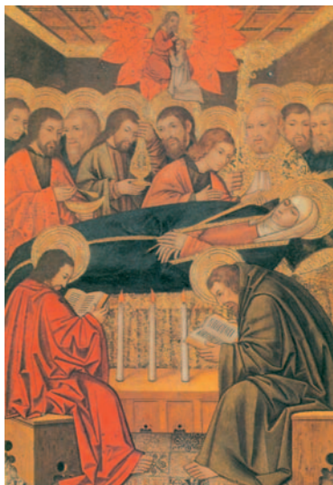
Dormició de la Mare de Déu. Pintura espanyola del s. XIV. Museu Tessé, Le Mans

M aria Assumpta és un nom entranyable i molt freqüent. Hi ha moltes mares i germanes nostres que el porten. I és el dia en què celebren el seu sant la majoria de nenes, joves i dones que porten el nom de Maria. És un misteri entranyable de la Mare de Déu. El celebrem a la meitat d'aquest mes d'agost i aquest any encara diríem que és més festa pel fet d'escaure's en diumenge. Són molt nombrosos els pobles, viles i ciutats de la nostra terra que celebren avui la seva festa major.