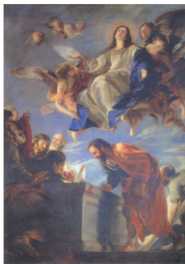
Assumpció de la Mare de Déu. Pintura de Mateo Cerezo (1626-1666). Museu del Prado, Madrid

María se quedó con Isabel unos tres meses y después volvió a su casa.