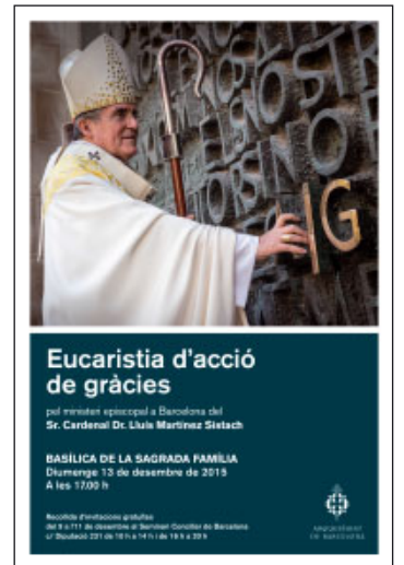
Eucaristia d'acció de gràcies

L'acte se celebrarà a la Sagrada Família. Per assistir-hi cal disposar d'una invitació gratuïta, sense la qual no es podrà accedir al temple, atès que l'aforament és limitat per les exigències establertes per les normes de seguretat. Les invitacions es lliuraran a la sala de visites de l'edifici del Seminari Conciliar de Barcelona (c/ Diputació, 231), de dimecres 9 a divendres 11 de desembre, de 10 a 14 h i de 16 a 20 h, fins a completar l'aforament de la basílica.