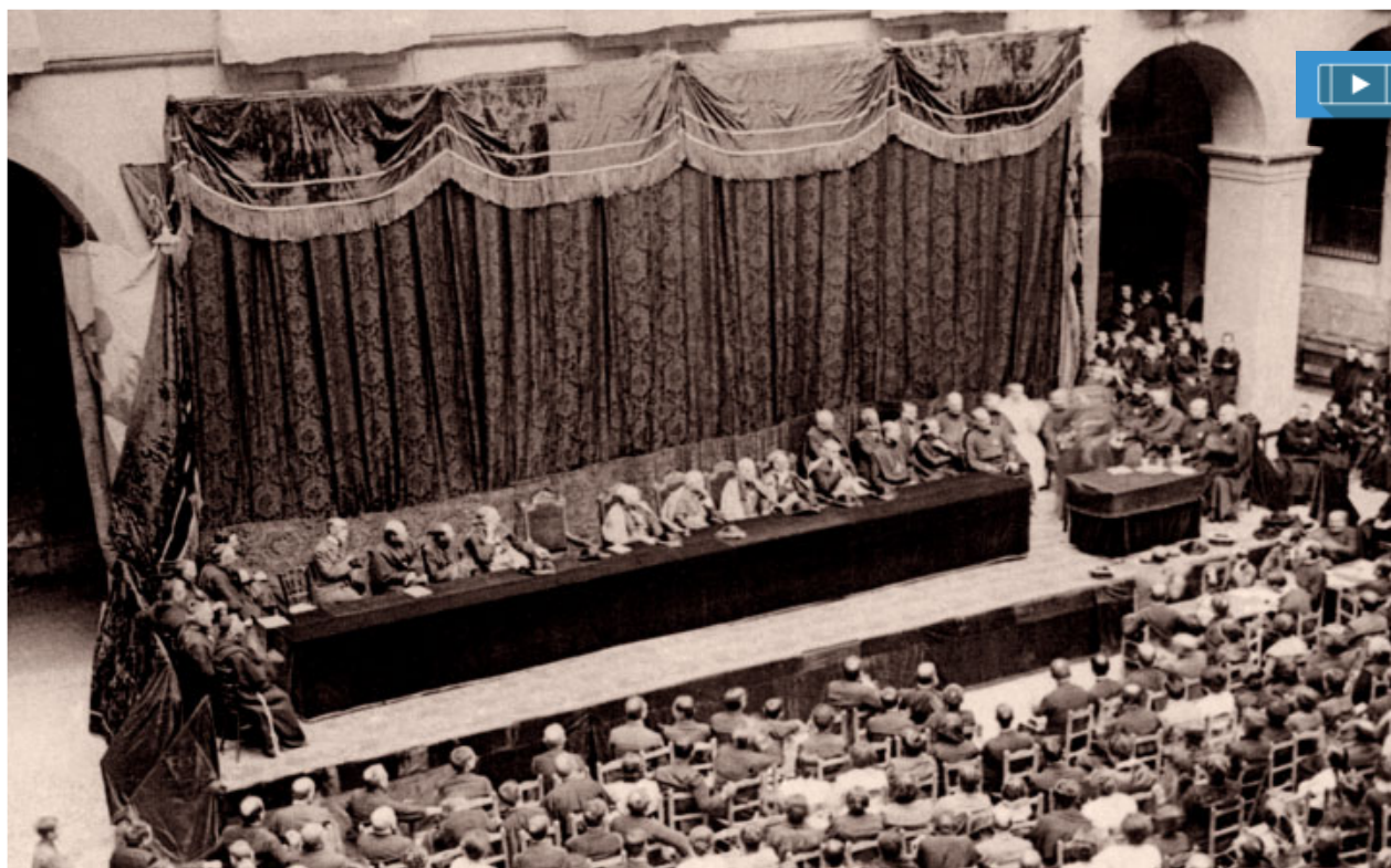
Primer Congrés Litúrgic de Montserrat celebrat l'any 1915

L'Església decidia fer la celebració de la missa i dels altres sacraments en les llengües vives per fer-los més propers i comprensibles, més participats per tota la comunitat i més ins-