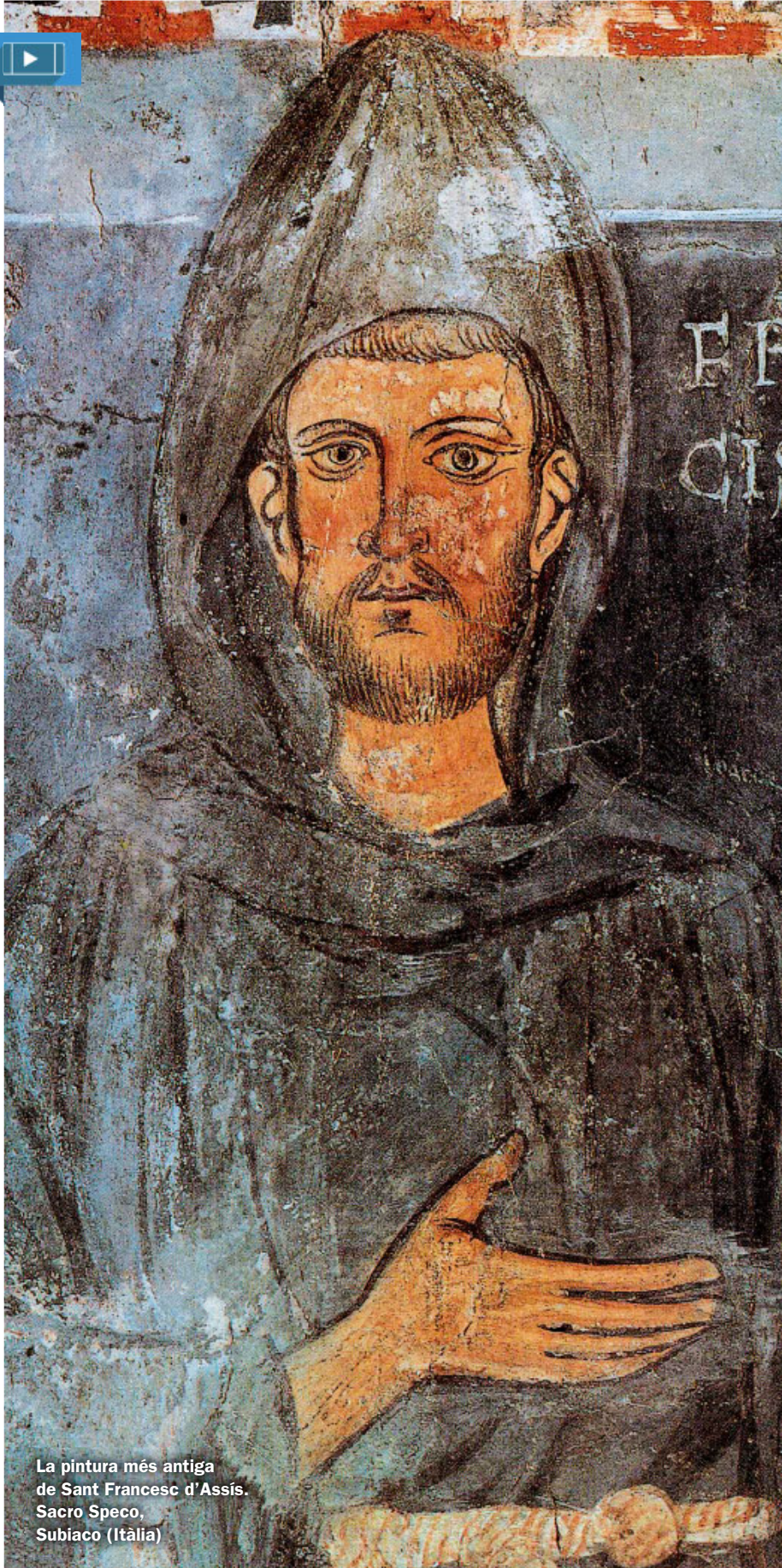
La pintura més antiga de Sant Francesc d'Assís. Sacro Speco, Subiaco (Itàlia)