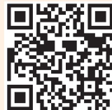
Accés al Breviari