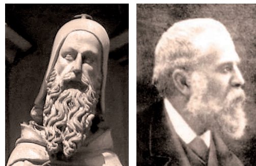
Aquesta imatge parla

En primer lloc, produeix una notable admiració l'agudesia i la intuïció de Josep Pla en preveure la dimensió universal que assoliria l'arquitecte de la Sagrada Família, quan tot just començava aquest fenomen. «Gaudí —afirma Josep Pla amb gran perspicàcia— és un dels catalans de volada més