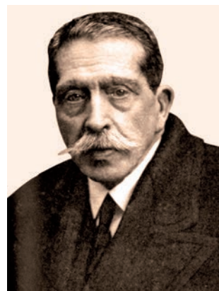
Aquesta imatge parla

Tots dos foren, doncs, grans representants d'aquest esperit a Catalunya. A Ruyra, se li pot aplicar el que diu Pla en el retrat que li va dedicar: com a escriptor «fou un càndid, perquè es necessita una gran candidesa per apassionar-se per les coses dels altres sense cap profit real i assegurat. Però el cert és que la naturalesa produeix aquesta classe d'inno-