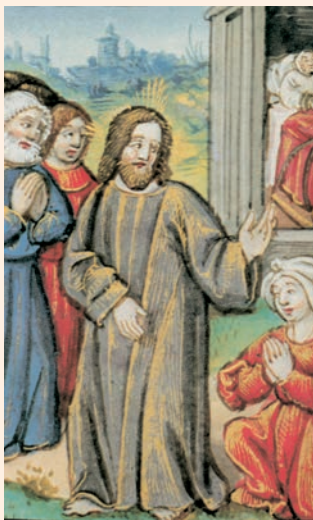
Jesús guareix la dona cananea. Miniatura d'un Evangeliari, Biblioteca Nacional (Madrid)

En aquel tiempo, Jesús salió y se retiró al país de Tiro y Sidón. Entonces una mujer cananea, saliendo de uno de aquellos lugares, se puso a gritarle: «Ten compasión de mí, Señor Hijo de David. Mi hija tiene un demonio muy malo.» Él no le respondió nada. Entonces los discípulos se le acercaron a decirle: «Atiéndela, que viene detrás gritando.» Él les contestó: «Sólo me han enviado a las ovejas descarriadas de Israel.» Ella los alcanzó y se postró ante él, y le pidió de rodillas: «Señor, socórreme.» Él le contestó: «No está bien echar a los perros el pan de los hijos.» Pero ella repuso: «Tienes razón, Señor; pero también los perros comen las migajas que caen de la mesa de los amos.» Jesús le respondió: «Mujer, qué grande es tu fe: que se cumpla lo que deseas.» En aquel momento quedó curada su hija.