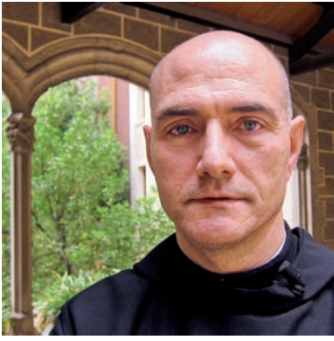
▶) Aquesta imatge parla