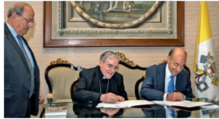
Aquesta imatge parla

El dia 7 del passat juliol, a la seu de l'Arquebisbat de Barcelona, es va firmar un acord de col·laboració entre el Museu Nacional d'Art de Catalunya (MNAC) i la basílica de la Sagrada Família per potenciar i difondre l'obra d'Antoni Gaudí i les arts del Modernisme. Un conjunt d'obres de la Casa-Museu Gaudí seran restaurades per equips del MNAC per tal de ser exposades a la Casa-Museu del Parc Güell.