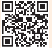
Accés al Breviari

11. □ Dilluns (lit. hores: 3a setm.) [Ez 1,2-5.24-2,1a / SI 148 / Mt 17,22-27]. Santa Clara (Assís 1193-1253), vg., fund. Clarisses (OSC, 1212), patrona de la televisió; sant Tiburci, mr.