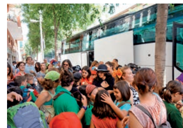
Aquesta imatge parla

Els anomenats casals d'estiu, en canvi, són activitats diàries, de tot el dia o d'unes hores, amb una durada variable, generalment d'un mes. Poden realitzar-se en totes les èpoques de l'any, però preferentment es fan a l'estiu. Altres activitats pròpies de les vacances són els campaments, que són estades en tendes de campanya instal·lades provisionalment en un lloc de muntanya. Les rutes són una activitat de caràcter itinerant amb els mateixos objectius ja indicats. I, finalment, els camps de treball són estades que s'organitzen en funció d'algun projecte de caràcter social, cultural o cívic. El meu record ple d'agraïment va a totes les persones que treballen en aquestes iniciatives i als pares i les mares que, sovint sense tenir ells vacances, les fan possibles per als seus fills o els fills d'altres famílies.