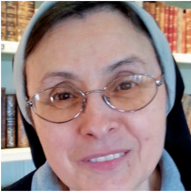
Aquesta imatge parla