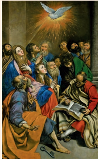
Pentecosta, pintura de Juan Bautista Maino (1578-1649)

Glòria al Senyor per sempre. / Que s'alegri el Senyor contemplant el que ha fet, / que li sigui agradable aquest poema, / són per al Senyor aquests cants de goig. R.