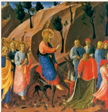
Entrada de Jesús a Jerusalem. Pintura del beat Fra Angèlic, Convent de Sant Marc (Florència)

Anunciaré als meus germans el vostre nom, / us lloaré enmig del poble reunit. / Fidels del Senyor, lloeu-lo, / fills de Jacob, glorifiqueu-lo, / reverencieu-lo, fills d'Israel. R.