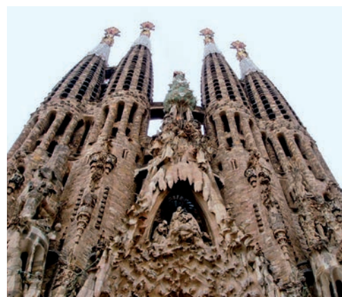
El temple de la Sagrada Família, un signe de Déu enmig d'una gran ciutat

Sempre he pensat que els pastors de les grans ciutats ens hauríem d'ajudar més. Durant les congregacions generals prèvies al conclave, vaig parlar d'això amb el cardenal Jorge Mario Bergoglio, arquebisbe d'una gran ciutat —Buenos Aires—, i coincidírem en aquest interès i preocupació.