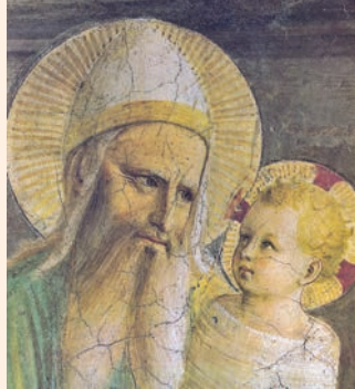
Presentació de Jesús al Temple. Fresc del beat Fra Angèlic, Convent de Sant Marc (Florència)

¿Quién es ese Rey de la gloria? / El Señor, Dios de los ejér- citos. / Él es el Rey de la gloria. R.