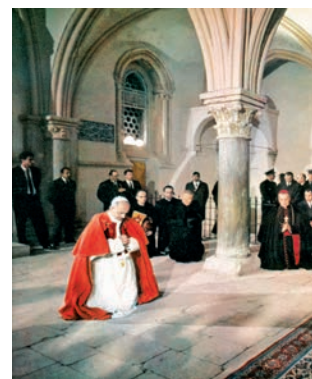
Pau VI, agenollat, prega al Cenacle el 5 de gener de 1964, durant el seu viatge a Terra Santa

† Lluís Martínez Sistach Cardenal arquebisbe de Barcelona