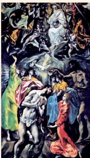
El bautismo del Señor. Pintura d'El Greco, Fundació Tavera (Tolèdo)

Entonces Juan se lo permitió. Apenas se bautizó Jesús, salió del agua; se abrió el cielo y vio que el Espíritu de Dios bajaba como una paloma y se posaba sobre él. Y vino una voz del cielo que decía: «Este es mi hijo, el amado, mi predilecto.»