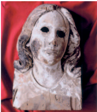
Mare de Déu de la ciutat de Nagasaki, cremada per la bomba atòmica (1945)