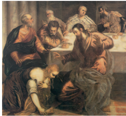
Jesús i la dona pecadora, pintura de Jacopo Robusti («il Tintoretto»), Venècia 1518-1594), Monestir de l'Escorial, Madrid

Al ver esto, el fariseo que lo había invitado se dijo: «Si este fuera profeta, sabría quién es esta mujer que lo está tocando y lo que es: una pecadora.» Jesús tomó la palabra y le dijo: «Simón, tengo algo que decirte.» Él respondió: «Dímelo, maestro.» Jesús le dijo: «Un prestamista tenía dos deudores: uno le debía quinientos denarios y el otro cincuenta. Como no tenían con qué pagar, los perdonó a los dos. ¿Cuál de los dos lo amará más?». Simón contestó: «Supongo que aquel a quien le perdonó más.» Jesús le dijo: «Has juzgado rectamente.» Y, volviéndose a la mujer, dijo a Simón: «¿Ves a esta mujer? Cuando yo entré a tu casa, no me pusiste agua para los pies; ella, en cambio, me ha lavado los pies con sus lágrimas y me los ha enjugado con su pelo. Tú no me besaste; ella, en cambio, desde que entró, no ha dejado de besar-me los pies. Tú no me ungió la cabeza con unguento; ella, en cambio, me ha ungió los pies con perfume. Por eso te digo, sus muchos pecados están perdonados, porque tiene mucho amor: pero al que poco se le perdona, poco ama.» Y a ella le dijo: «Tus pecados están perdonados.» Los demás convidados empezaron a decir entre sí: «¿Quién es este, que hasta perdona pecados? Pero Jesús dijo a la mujer: «Tu fe te ha salvado, vete en paz.»