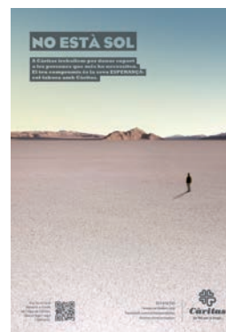
Aquesta imatge parla

La campanya nadalenca d'enguany d'aquesta obra de l'Església fa una crida a l'esperança i al compromís. El lema escollit diu: «A Càritas treballem per donar suport a les persones que més ho necessiten. El teu compromís és la seva esperança». L'esperança que necessita la persona que s'adreça a Càritas cercant el suport i el compromís de les persones que ofereixen la seva col·laboració. El proper diumenge es farà una col·lecció en totes les esglésies destinada a aquesta campanya de Nadal.