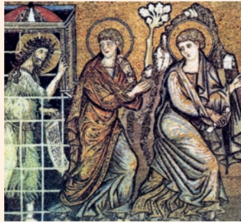
Joan Baptista envia els seus deixebles a Jesús. Mosaic del baptisteri de la catedral de Florència (s. XII)

Volverán los rescatados del Señor, vendrán a Sión con cánticos: en cabeza, alegría perpetua; siguiéndolos, gozo y alegría. Pena y aflicción se alejarán.