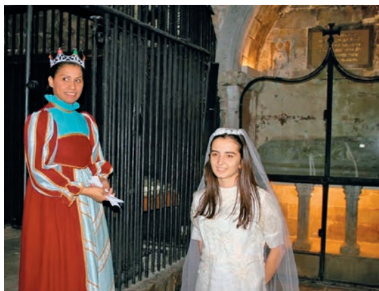
Aquesta imatge parla

centos joves varen representar algunes figures o esdeveniments de la nostra catedral, des de la màrtir Eulàlia, que apareix en la fotografia, fins a figures com Ramon de Penyafort o el bisbe Oleguer, presentats per nois i noies que portaven vestits d'època.