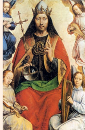
Crist Rei de l'Univers. Pintura del taller de Memling (s. xv), Museu de Belles Arts d'Estrasburg.

Se burlaban de él también los soldados, ofreciéndole vinagre y diciendo: «Si eres tú el rey de los judíos, sálvate a ti mismo.» Había encima un letrero en escritura griega, latina y hebrea: «Este es el rey de los judíos.» Uno de los malhechores crucificados lo insultaba, diciendo: «¿No eres tú el Mesías? Sálvate a ti mismo y a nosotros.» Pero el otro lo increpaba: «¿Ni siquiera temes tú a Dios, estando en el mismo suplicio? Y lo nuestro es justo, porque recibimos el pago de lo que hicimos; en cambio, este no ha faltado en nada.» Y decía: «Jesús, acuérdate de mí cuando llegues a tu reino.» Jesús le respondió: «Te lo aseguro: hoy estarás conmigo en el paraíso.»