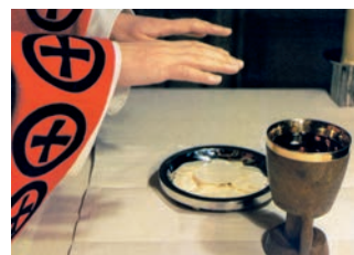
La dimensió eclesial de la fe s'expressa sobretot a l'eucaristia

Avui més que mai, per tal de viure la fe, és imprescindible el suport i el clima que pot aportar una veritable comunitat cristiana. I la primera i més gran comunitat cristiana és l'Església. Ella és la mare de la nostra fe.