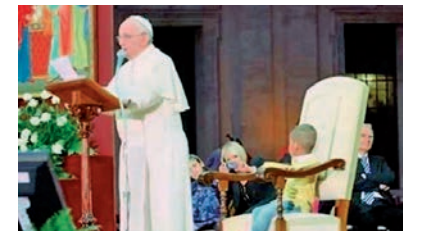
Aquesta imatge parla

Un nen amb iniciativa. El diumenge 26 d'octubre, mentre el papa s'adreçava a les famílies que omplien la plaça de Sant Pere per una Jornada de la Família, un nen s'acostà al Sant Pare, que l'acaronà. El nen es trobava bé prop del Papa i algunes persones li van oferir caramels per mirar d'engalipar-lo perquè se n'apartés. Però l'infant va continuar allà i va arribar a seure a la cadira papal.