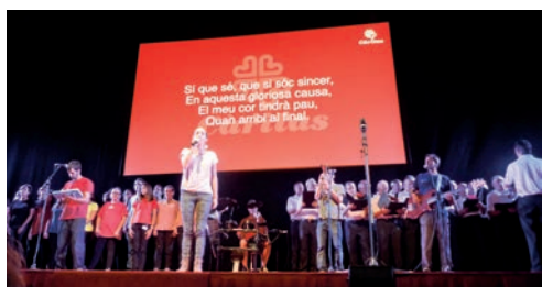
Aquesta imatge parla

gües familiars i sense prestació d'atur. A la presentació del projecte —titulat «Feina amb cor»—, hi varen assistir uns 200 empresaris, representants de 130 empreses disposades a fer contractes de formació o de pràctiques amb Càritas. Són les «Empreses amb cor». «L'acollida i l'acompanyament són els pilars bàsics de Càritas», va dir el cardenal. Foto: Una de les actuacions musicals que varen acompanyar l'acte.