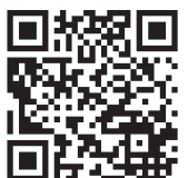
«) aquesta imatge parla