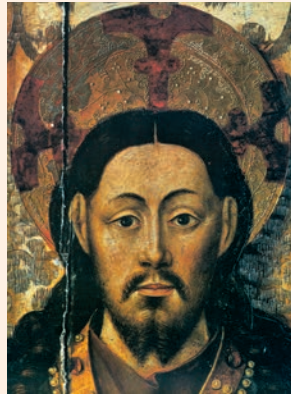
Faç de Crist, del retaule La Santa Cena , procedent de l'antiga Cartoixa de Caldecristo (Museu de la Catedral de Sogorb)

Levanta del polvo al desvalido, / alza de la basura al pobre, / para sentarlo con los príncipes, / los príncipes de su pueblo. R.