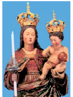
Imatge de la Mare de Déu de Bonaria, a Càller (Sardenya)