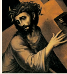
Crist portant la creu (fragment). Obra de Luis de Morales, Galleria degli Uffizi (Firenze)

Y el Señor se arrepintió de la amenaza que había pronunciado contra su pueblo.