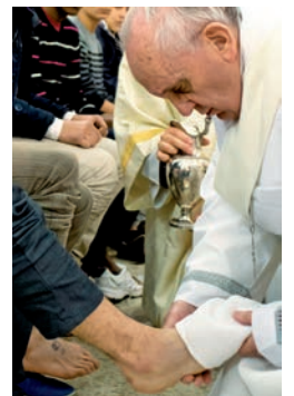
El papa Francesc repeteix el gest fet per Crist el Dijous Sant, signe de servei i d'amor