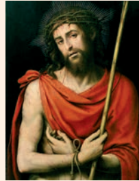
Crist, signe de contradicció. Ecce homo , de Juan de Juanes, Museu Provincial de València

Ellos cogieron a Jeremías y lo arrojaron en el aljibe de Malquías, príncipe real, en el patio de la guardia, descolgándolo con sogas. En el aljibe no había agua, sino lodo, y Jeremías se hundió en el lodo. Ebedmelek salió del palacio y habló al rey: «Mi rey y señor, esos hombres han tratado inicuaemente al profeta Jeremías, arrojándolo al aljibe, donde morirá de hambre, porque no queda pan en la ciudad.» Entonces el rey ordenó a Ebedmelek, el cusita: «Toma tres hombres a tu mando, y sacad al profeta Jeremías del aljibe, antes de que muera.»