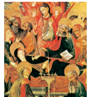
Dormició de santa Maria envoltada per Crist i els Apòstols. Museu Marés (Barcelona)

Les paraules que Elisabet dirigí a Maria ens apropen moltíssim aquesta noia de Natzaret: «Benaurada tu que has cregut». És la gran lloança de la fe de la Mare de Déu. És el reconeixement que la seva major grandesa radica en la seva vida de fe.