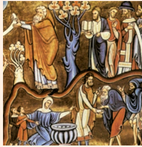
El veritable creient està sempre a punt, fent obres de misericòrdia. (Miniatura del Salteri de Canterbury)

Los hijos piadosos de un pueblo justo ofrecían sacrificios a escondidas y, de común acuerdo, se imponían esta ley sagrada: que todos los santos serían solidarios en los peligros y en los bienes; y empezaron a entonar los himnos tradicionales.