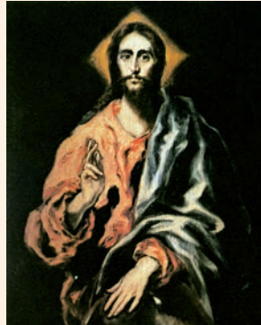
El Salvador. Pintura d'El Greco, sagristia de la catedral de Toledo

Me enseñarás el sendero de la vida, / me saciarás de gozo en tu presencia, / de alegría perpetua a tu derecha. R.