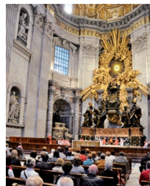
El recent pelegrinatge diocesà a Roma ha estat l'ocasió de renovar la comunió amb el Papa Francesc. La imatge recull la celebració de la missa a l'altar de la Càtedra de Pere.

† Lluís Martínez Sistach Cardenal arquebisbe de Barcelona