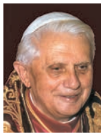
Santifica el teu nom

E l que va començar per a Moisès a la vora de la bardissa ardent en el desert del Sinaí, s'acaba en la bardissa ardent de la creu. Realment, podem adreçar la paraula a Déu en el seu Fill encarnat. Ell forma part del nostre món. Ell s'ha lliurat a les nostres mans. Així, entenem què volem dir quan demanem que sigui santificat el nom de Déu. Es pot abusar del nom de Déu, i d'aquesta manera podem desfigurar la imatge de Déu. Com més ell es dona a les nostres mans, més podem eclipsar la seva llum.