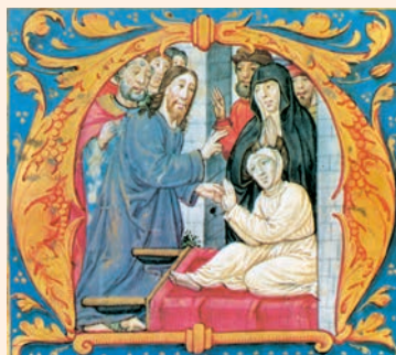
Resurrecció del fill de la viuda. Miniatura del Missal del cardenal Cisneros, Biblioteca Nacional (Madrid)

Escolteu, Senyor, compadiu-vos de mi; / ajudeu-me, Senyor. / Heu mutat en joia les meves penes. / Senyor, Déu meu, us lloa- ré per sempre. R.