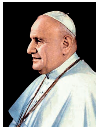
El Papa Joan XXIII (1958-1963), que convocà el Concili Vaticà II

L'encíclica, que podríem considerar també com el testament del Papa Roncalli per al món, porta la data de l'11 d'abril de l'any 1963, un Dijous Sant, sis mesos després d'haver inaugurat el Concili Vaticà II i quan Joan XXIII ja estava greument malalt. Morí el 3 de juny d'aquell mateix any.