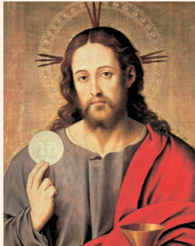
El Salvador eucarístic. Pintura de Juan de Juanes (1523?-1579?). Museu del Prado (Madrid)

Jesús dijo a sus discípulos: «Decidles que se echen en grupos de unos cincuenta.» Lo hicieron así, y todos se echaron. Él, tomando los cinco panes y los dos peces, alzó la mirada al cielo, pronunció la bendición sobre ellos, los partió y se los dio a los discípulos para que se los sirvieran a la gente. Comieron todos y se saciaron, y cogieron las sobras: doce cestos.