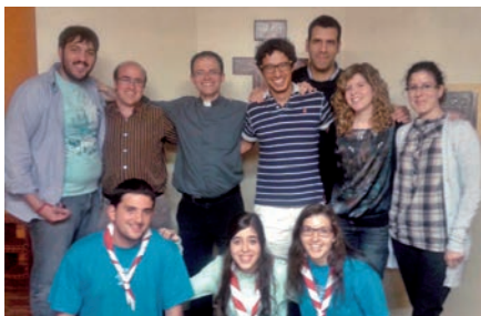
«) aquesta imatge parla

Resten menys de dos mesos per a la Jornada Mundial de la Joventut, que tindrà lloc a Rio de Janeiro (Brasil). Des de la Delegació de Joventut s'ha posat en marxa una campanya anomenada «Apadrina un pelegrí». Aquesta consisteix en què els fidels puguin apadrinar els 20.000 km del viatge a canvi de pregàries per la diòcesi. El trajecte és des de Barcelona a Sao