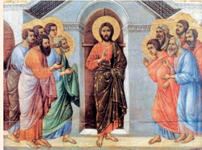
Jesucrist ressuscitat s'apareix als apòstols. Pintura de Duccio di Buoninsegna, Catedral de Siena (Itàlia)

La paz os dejo, mi paz os doy; no os la doy yo como la da el mundo. Que no tiemble vuestro corazón ni se acobarde. Me habéis oído decir: "Me voy y vuelvo a vuestro lado". Si me amarais, os alegraríais de que vaya al Padre, porque el Padre es más que yo. Os lo he dicho ahora, antes de que suceda, para que cuando suceda sigáis creyendo.»