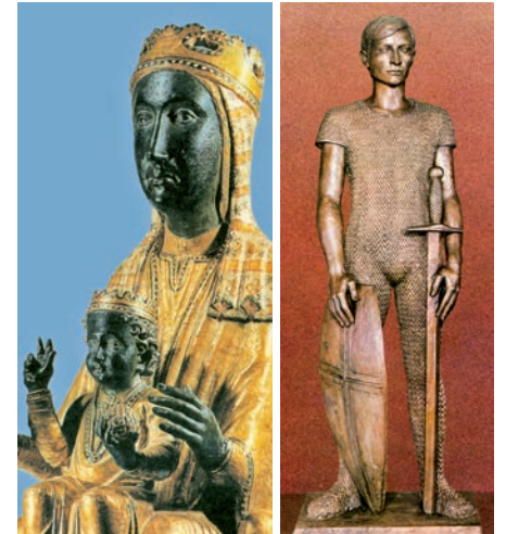
La Mare de Déu de Montserrat i Sant Jordi (escultura de Joan Rebull, parròquia de Sant Jordi de Vallcarca, Barcelona)

Aquesta setmana celebrem les festes patronals de Catalunya: el dimarts Sant Jordi i el dissabte la Mare de Déu de Montserrat. Sant Jordi fou un màrtir molt venerat a l'antigor. Sembla que era un soldat romà de l'Orient, que es va fer cristià i morí com a màrtir de Crist en les persecucions del segle III. Des de l'Orient la devoció a aquest gran màrtir —fou anomenat el megalomàrtir o el màrtir per excel·lència— es va estendre cap a Occident, on avui continua essent el patró de molts països, entre els quals hi ha Catalunya.