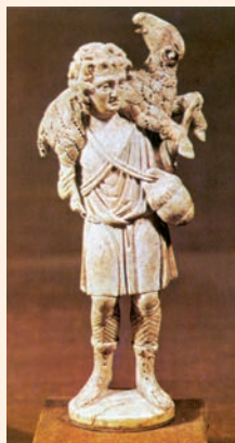
Jesucrist, Bon Pastor. Escultura cristiana del segle III, Museu del Louvre (París)

Però els jueus instigaren les dones devotes més distingides i els principals de la ciutat a promoure una persecució contra Pau i Bernabé, fins que els expulsaren del seu territori. Ells, en senyal de protesta, s'espolsaren els peus sobre els qui els feien marxar, i se n'anaren a Iconi. Els convertits de nou vivien feliços, plens d'alegria i de l'Esperit Sant.