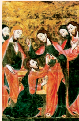
El dubte de Sant Tomàs. Pintura procedent de Lladó (Girona), MNAC (Barcelona)

La gente sacaba los enfermos a la calle, y los ponía en catres y camillas, para que, al pasar Pedro, su sombra, por lo menos, cayera sobre alguno. Mucha gente de los alrededores acudía a Jerusalén, llevando a enfermos y poseídos de espíritu inmundo, y todos se curaban.