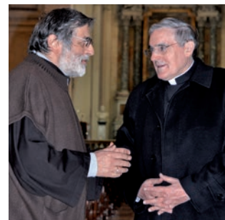
El Cardenal a la basílica de Sant Sebastià de les Catacumbes de la qual és titular