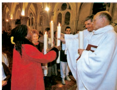
El ciri pasqual i la llum, símbols de Crist en la Vetlla Pasqual