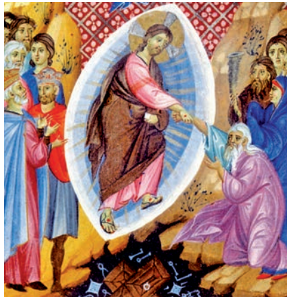
Crist al si d'Abraham. Saltiri Smith Lesouéf (s. XIII), Biblioteca Nacional, París