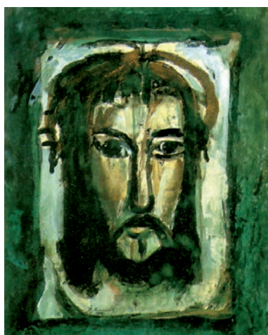
La Santa Faç, pintura de Georges Rouault. Col·lecció privada

C. Tomaron a Jesús, y él, cargado con la cruz, salió al sitio llamado «de la Calavera» (que en hebreo se dice Gòlgota), donde lo crucificaron; y con él a otros dos, uno a cada lado, y en medio, Jesús. Y Pilato escribió un letrero y lo puso encima de la cruz; en él estaba escrito: «Jesús el Nazareno, el rey de los judíos.»