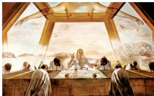
El Darrer Sopar, pintura de Salvador Dalí. National Gallery of Art, Washington

Cuando acabó de lavarles los pies, tomó el manto, y se lo puso otra vez y les dijo: «¿Comprendéis lo que he hecho con vosotros? Vosotros me llamáis "el Maestro" y "el Señor", y decís bien, porque lo soy. Pues si yo, el Maestro y el Señor, os he lavado los pies, también vosotros debéis lavaros los pies unos a otros; os he dado ejemplo para que lo que yo he hecho con vosotros, vosotros también lo hagáis.»