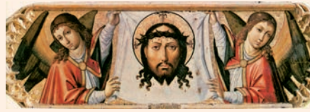
Santa Faç del Crist sofrent. Pintura del Mestre de Perea, València

En sentir això, tots els qui eren a la sinagoga, indignats, es posaren a peu dret, el tragueren del poble i el dugueren cap a un cingle de la muntanya on hi havia el poble per estimbar-lo. Però ell se n'anà passant entremig d'ells.