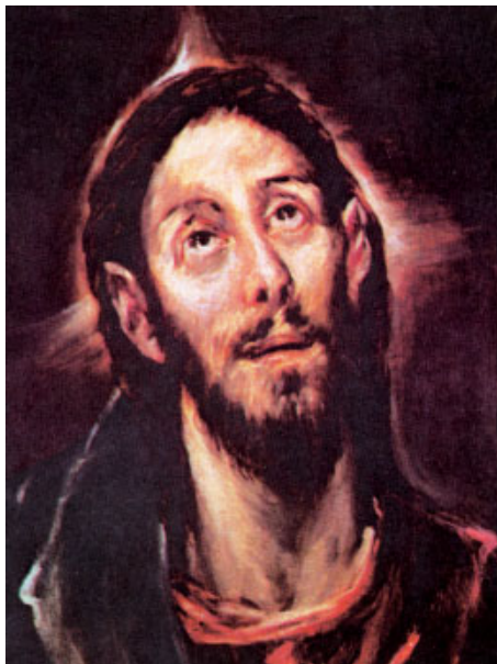
Crist Salvador. Pintura d'El Greco, Sala del Redemptor (Ciutat del Vaticà)

Él, a pesar de ser Hijo, aprendió, sufriendo, a obedecer. Y, llevado a la consumación, se ha convertido para todos los que le obedecen en autor de salvación eterna.