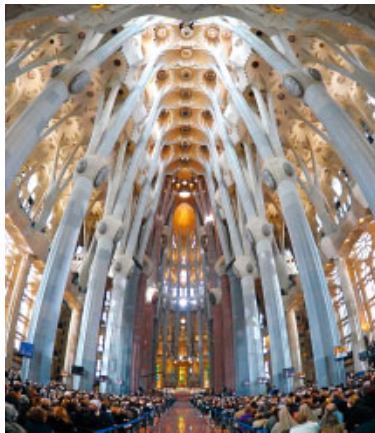
La basílica de la Sagrada Família va acollir ahir a la tarda l'acte dedicat a les famílies

Per això, els bisbes de les dotze Esglésies diocesanes que fem la Missió Metròpolis ens hem proposat fer tres catequisis o exposicions de la fe cristiana adaptades a tres grups de persones: una als catecúmens, una altra als joves i una darrera a