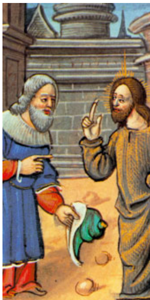
El diàleg de Jesús i Nicodem. Miniatura d'un còdex de la Biblioteca Nacional de Madrid

Que se me pegue la lengua al paladar / si no me acuerdo de ti, / si no pongo a Jerusalén / en la cumbre de mis alegrías. R.