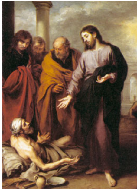
Jesús guareix un paralític. Pintura de Murillo. Galeria Nacional de Londres

Unos escribas, que estaban allí sentados, pensaban para sus adentros: «¿Por qué habla este así? Blasfema. ¿Quién puede perdonar pecados, fuera de Dios?» Jesús se dio cuenta de lo que pensaban y les dijo: «¿Por qué pensáis eso? ¿Qué es más fácil: decirle al paralítico "tus pecados quedan perdonados" o decirle "levántate, coge la camilla y echa a andar"? Pues, para que veáis que el Hijo del hombre tiene potestad en la tierra para perdonar pecados...» Entonces le dijo al paralítico: «Contigo hablo: Levántate, coge tu camilla y vete a tu casa.» Se levantó inmediatamente, cogió la camilla y salió a la vista de todos. Se quedaron atónitos y daban gloria a Dios, diciendo: «Nunca hemos visto una cosa igual.»