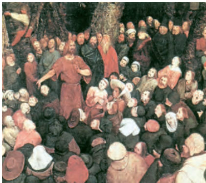
Predicació de sant Joan Baptista. Pintura de Brueghel el Vell, Museu de Belles Arts de Budapest

Al ir, iba llorando, / llevando la semilla; / al volver, vuelve cantando, / trayendo sus gavillas. R.