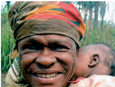
L'Església no ha oblidat Àfrica, el continent de l'esperança

Ja en altres ocasions he parlat de la mala premsa que té aquest continent en els països d'Occident. Sembla que els mitjans només mostrin imatges africanes quan hi ha corrupció, terrorisme, fam i malalties (amb els 24 milions d'infectats per la sida). Però la realitat del continent negre, quant a la vida de les seves poblacions, és molt diferent. Àfrica, amb els seus mil milions d'habitants, és una gran reserva en molts ordres, també en l'ordre dels valors humans.