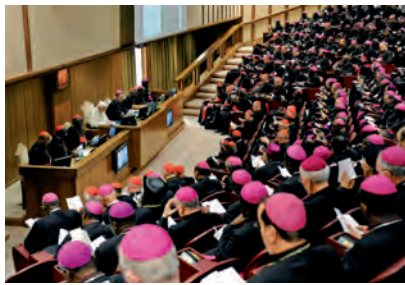
El Sínode que avui es clou ha estat format per 262 pares sinodals, el més nombrós dels que s'han celebrat

Cada dia estic més convençut que la nostra primera missió en aquest temps de la història dels homes és proposar l'Evangelí de la vida i de la salvació que Déu anuncia i realitza enviant el seu Fill únic. Ell ha vingut perquè tinguem vida sobreabundant i ens envia perquè els homes i les dones tinguin aquesta vida i el món sigui salvat.