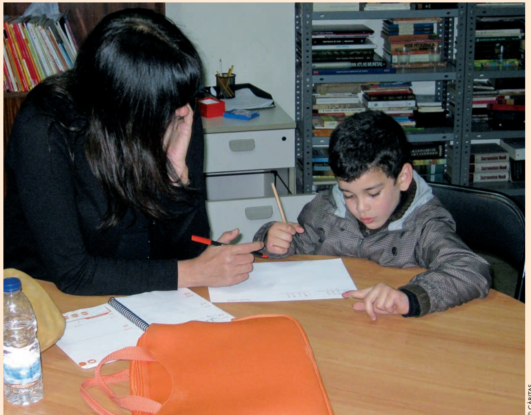
Una voluntaria del refuerzo educativo ayuda a un niño a hacer los deberes

Otro de los elementos a destacar es el contacto constante con las familias , ya sea de forma más personalizada en el día a día, como en las reuniones que se organizan periódicamente para todos los padres y madres.