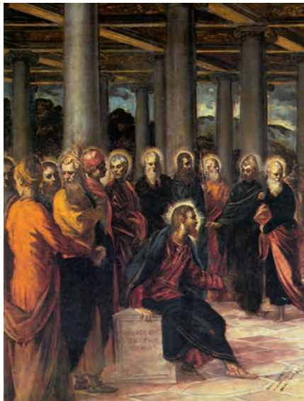
Un grup de fariseus entorn de Jesús. Pintura de Tintoretto, Galleria Barberini (Roma)

«Escuchad y entended todos: Nada que entre de fuera puede hacer al hombre impuro; lo que sale de dentro es lo que hace impuro al hombre. Porque de dentro, del corazón del hombre, salen los malos propósitos, las fornicaciones, robos, homicidios, adulterios, codicias, injusticias, fraudes, desenfreno, envidia, difamación, orgullo, frivolidad. Todas esas maldades salen de dentro y hacen al hombre impuro.»