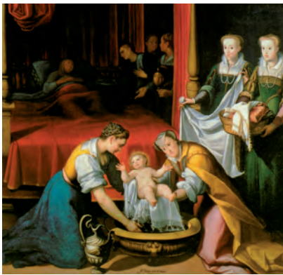
El naixement de la Mare de Déu. Pintura de Juan Pantoja de la Cruz (1553-1608), Museu del Prado (Madrid)

Amb motiu d'aquestes festes, ens agrada recordar i enaltir la gran dignitat de Maria i els seus excelsos privilegis. Això és bo perquè es tracta de veritats que pertanyen a la nostra fe. Però em sembla que avui existeix una necessitat urgent: la de fer que el poble de Déu conegui cada vegada més, entre altres coses, la immensa personalitat de Maria com a cristiana, com a dona de fe.